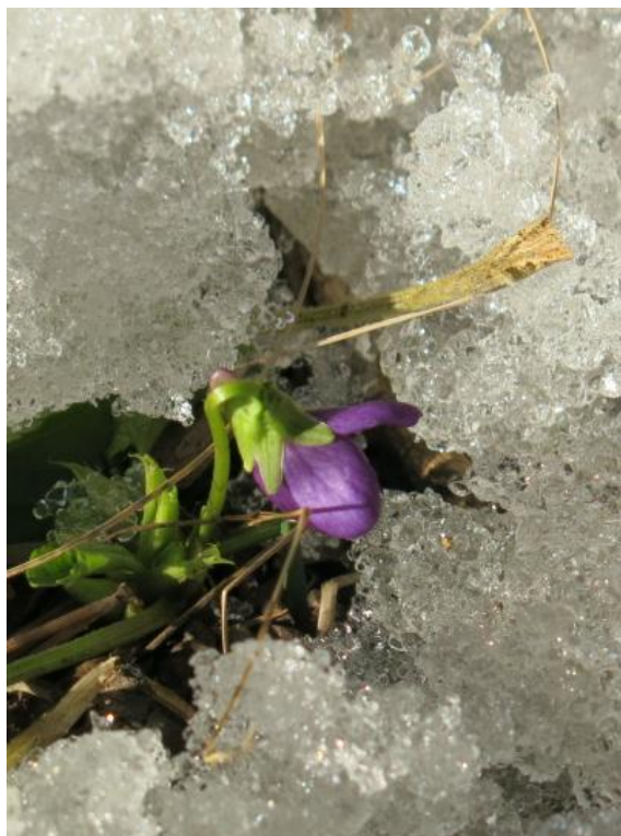
Auch diese Bild kann eine Bildunterschrift haben.

Auch können Bilder im Fließtext eingebunden werden: